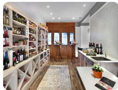
Queviures i Embotits Mitjans