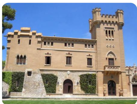
Bodegas Torre del Veguer

De stop in Sitges heeft als toegevoegde waarde dat je er de wijn Malvasía de Sitges kunt proeven, een gastronomisch, historisch en cultureel erfgoed dat nauw verbonden is met de stad. Meer daarover ontdek je (uiteraard inclusief degustatie) in het interpretatiecentrum Centre d'Interpretació de la Malvasia (CIM, Malvasia Interpretation Centre) van het wijnhuis Celler de l'Hospital.