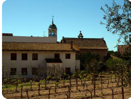
Centro de Interpretación de la Malvasia de Sitges