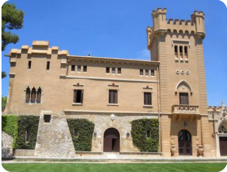
Bodegas Torre del Veguer

Der Stopp in Sitges bietet den zusätzlichen Reiz, den Wein Malvasia de Sitges, ein gastronomisches, historisches und kulturelles Erbe, über dessen Bedeutung, Einzigartigkeit und Verbreitung Sie im Centre d'Interpretació de la Malvasia (CIM) des Celler de l'Hospital ausführliche Informationen (inklusive Verkostung) erhalten.