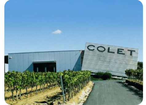
Colet Clàssic Penedès