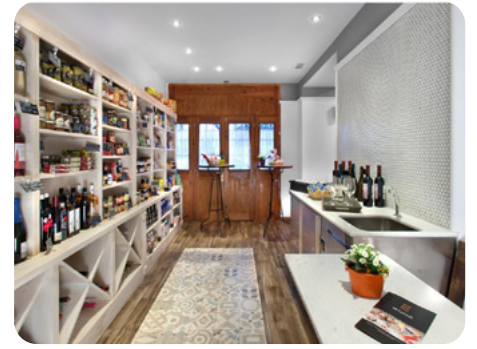
Queviures i Embotits Mitjans