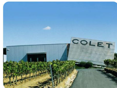
Colet Clàssic Penedès