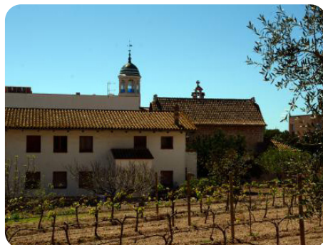
Centre d'Interpretación de la Malvasia de Sitges