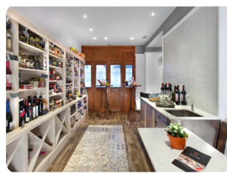
Queviures i Embotits Mitjans